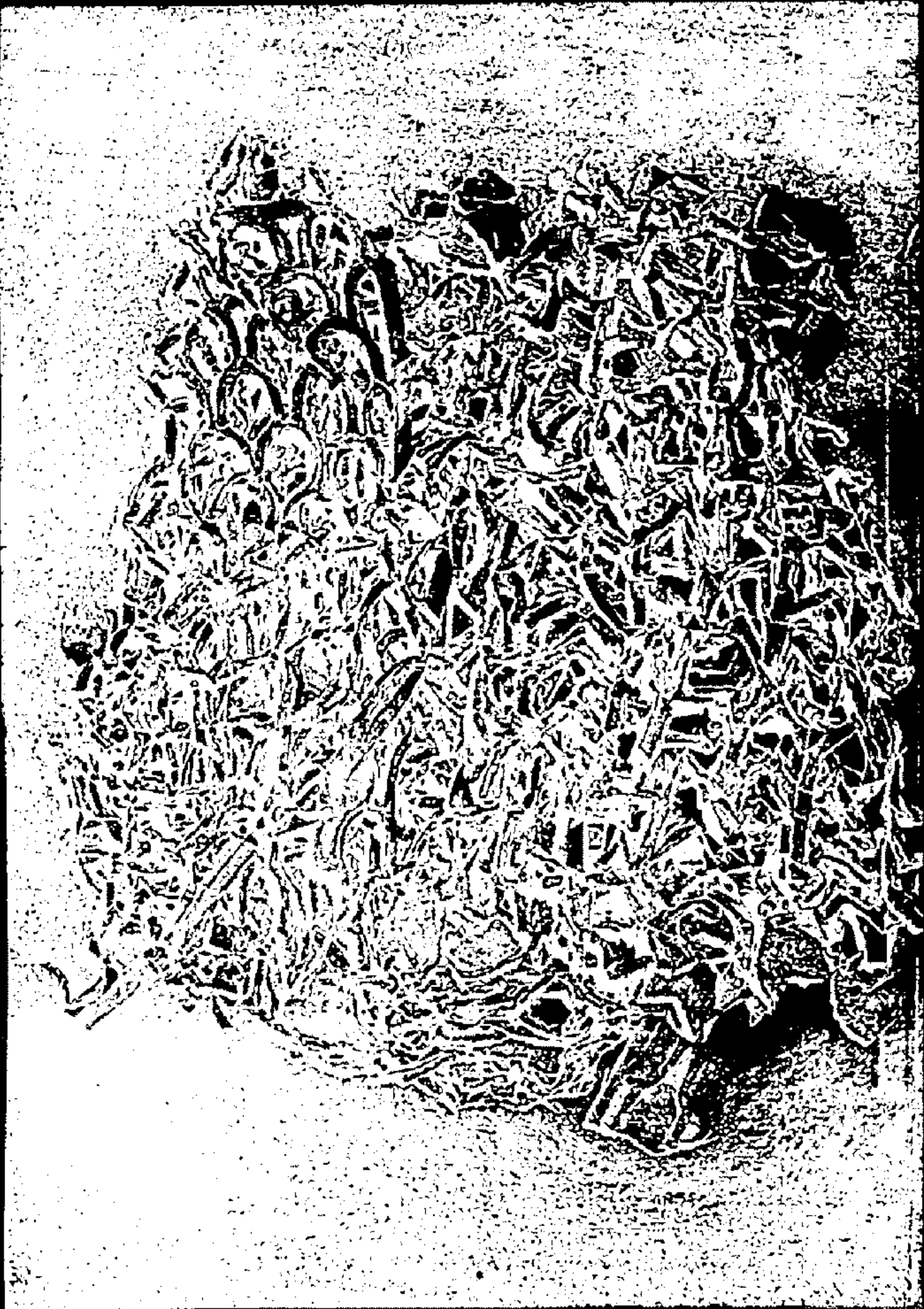
Lower part of the coffin of tomb KV 55