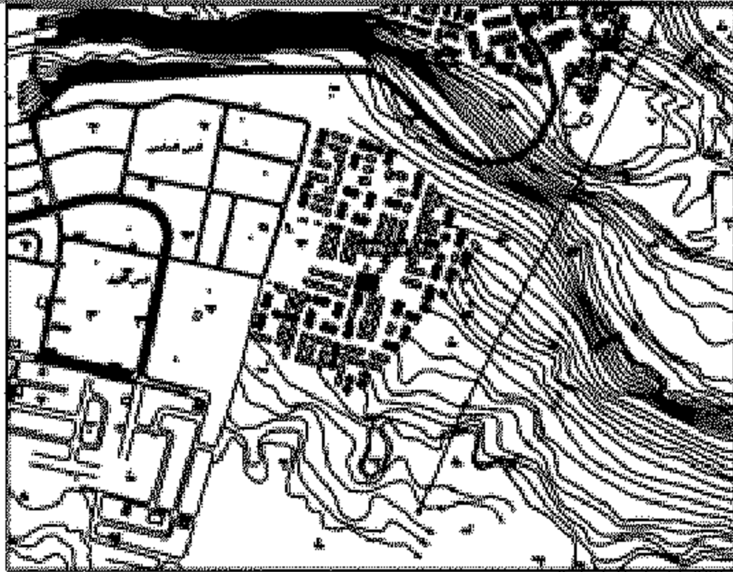
خريطة سماوية رقم (١٥٣٧)

المواقع العام للقطعة الأرض الكافية بمساحة الـ٧٠٠٠م٢ بالعنيزة الوسطى بالمنظم بمساحة ٣٣٥٠ م٢ تقريبا المطلوب تخصيصها لإقامة قاعة شرطة ومركز إطفاء لصالح مديرية أمن القاهرة