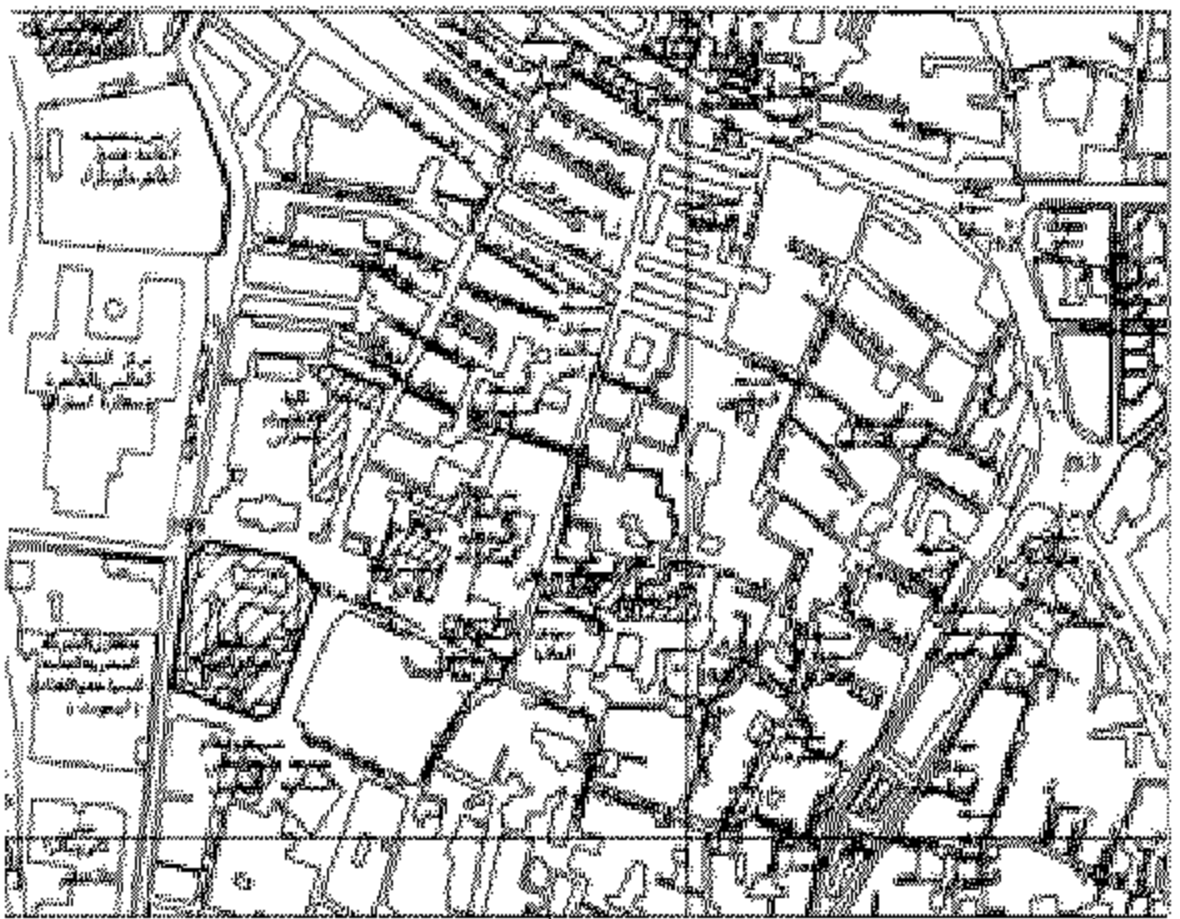
جزء من الخريطة السكنية رقم ١٠٤

المواقع العام لتقسيم الأرض الكافية بخارج المنطقة الاطية بين بولاق و الطام عليها مستطين بولاق العام و المستطين لتقسيم اسطح شوية الشون السكنية