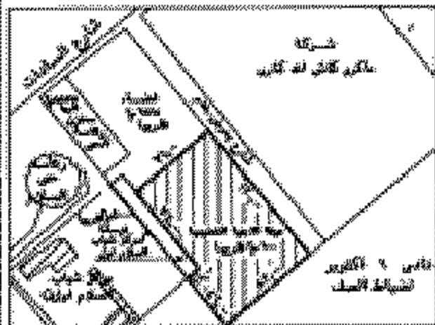
مدرسة السلام (٣)

مع مراعاة خطوط التقسيم المعتمدة و الاستخدام المخطط