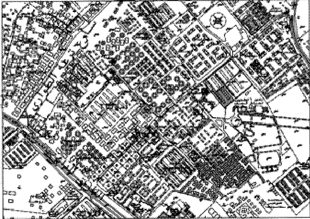
جزء من الخرائط المساحية لقطر (١١٠) - (١١١) - (١١٢) - (١١٣)

التوزيع العام لقطعة الأرض المأهولة ضمن المنطقة أملاك (٢٧) بمدينة السلام بنطاق من السلام اول بمساحة ٩٠٠٠ م ٢ للتربية و المطلوب تخصيصها لصالح الهيئة العامة للإحياء التعليمية لإقامة مدارس عليها