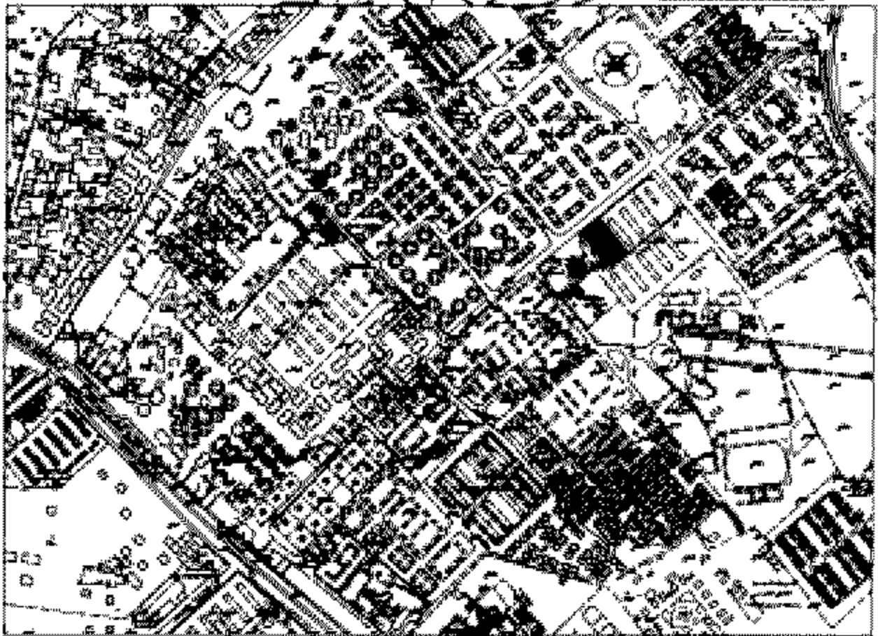
جزء من الخرائط المساحية رقم (١٠١٠-١١٠٠-١٢٠٠-١٣٠٠)

المواقع المزمع لقطع الأرض الكلية ضمن مساحة (٣) بجمهورية مصر من السلام اول بمدينة