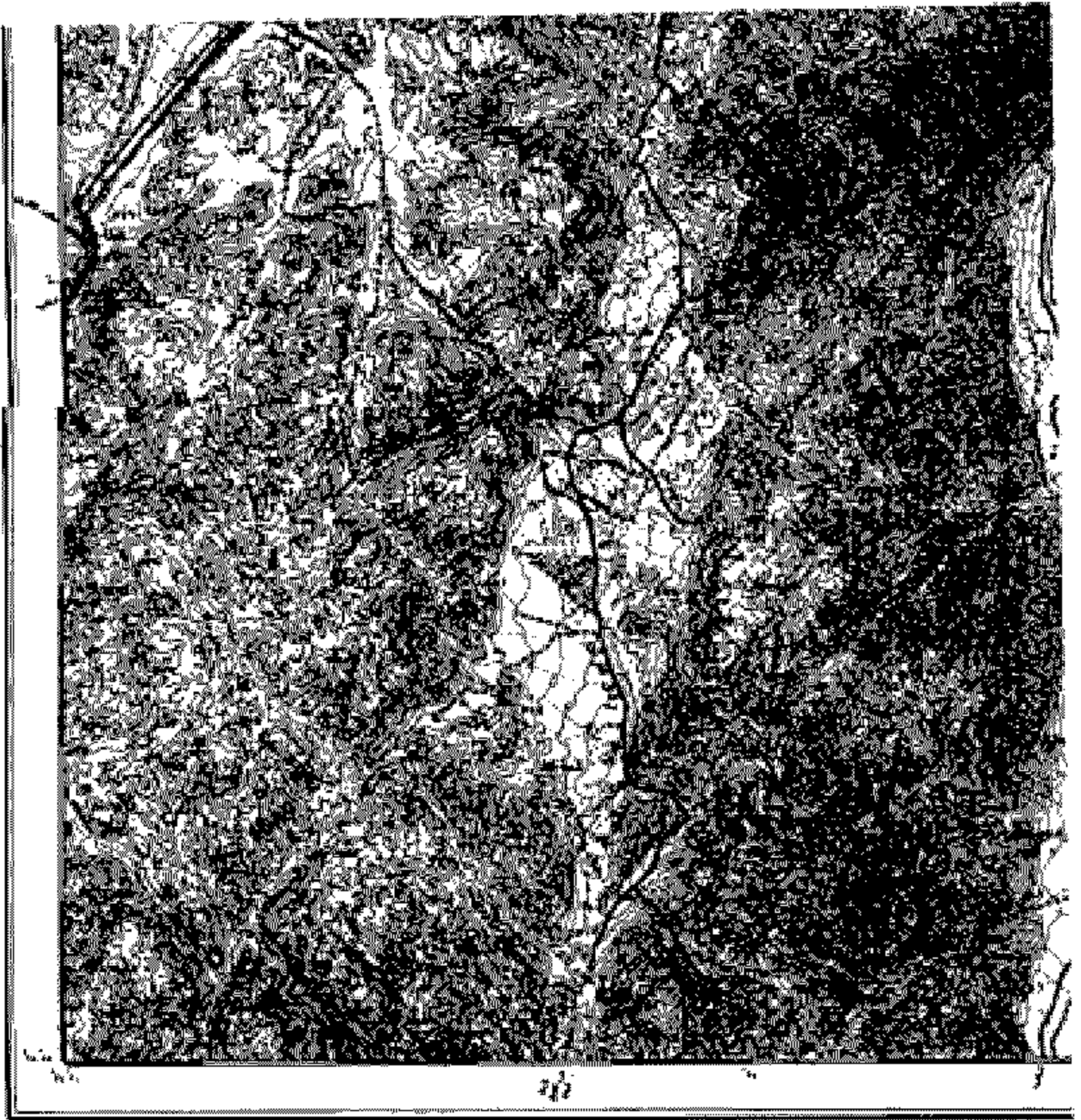
خريطة المنطقة الإدارية لبلدية الخرج - المنطقة الإدارية لبلدية الخرج - المنطقة الإدارية لبلدية الخرج