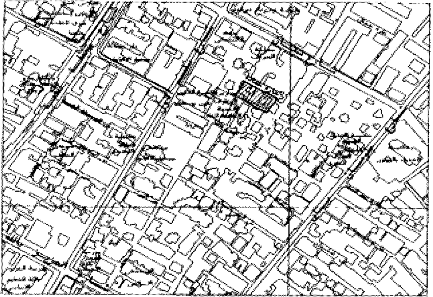
جزء من الخريطة المساحية ك٢٣

الموقع العام للقطعة الأرض الواقعة نهاية حارة حسادة من شارع سليم الأول بتقاطع عن الزياتون بمساحة ٢.٣٢٦,٩ م ٢ تقريبا المقابل لقطعا بتعريف مطاول لالامارة مسجد في حكم ملكة الك والمطلوب تخصيصا لصالح وزارة الأوقاف