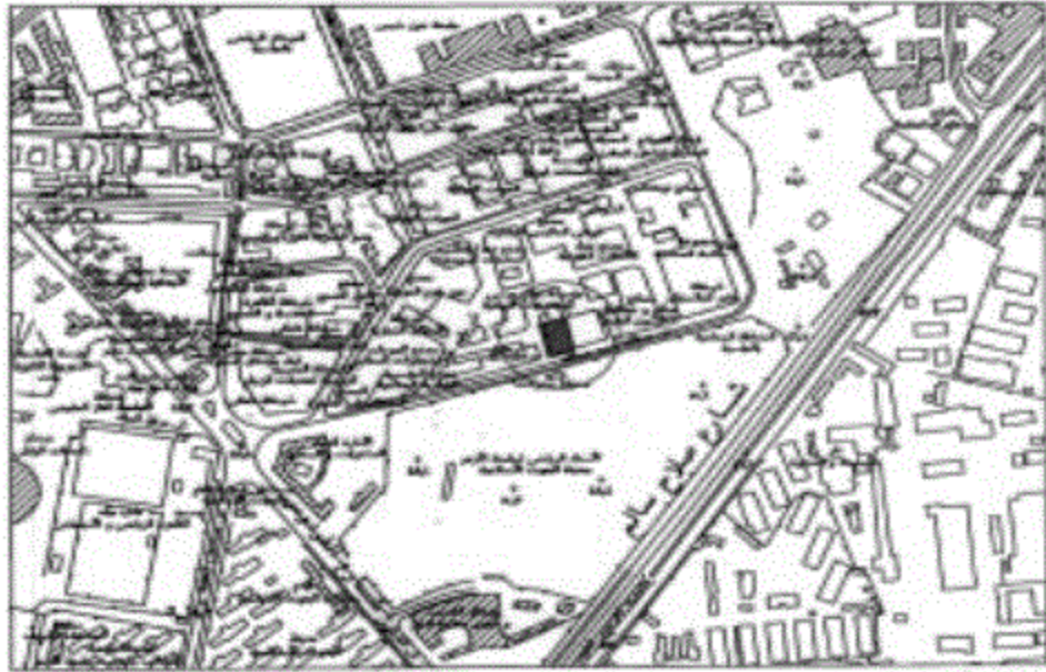
جزء من الخريطة الصناعية رقم ١٨ الموقع المأمور لقطعة الأرض رقم ٢ المنطقة الصناعية بالمعاسية بمساحة ١٨٧,١ م ٢ تقريبا المنظوب تخصيصا لصالح المديرية العامة لمحافظة القاهرة لإقامة جيش للتصويرية ومركز تدريب عظيم