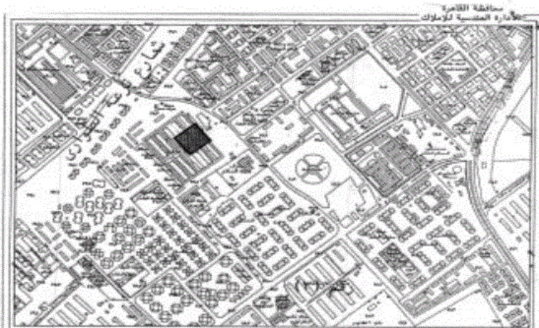
جزء من الخريطة المساحية (NB) الموقع العام للقطعة الارض الكاتبة ضمن محطة املاك (١) بمسطح ٢٠٠ م ٢ تقريبا المطلوب تشييدها لصالح مديرية الشباب والرياضة لاقامة مركز شباب وملاعب