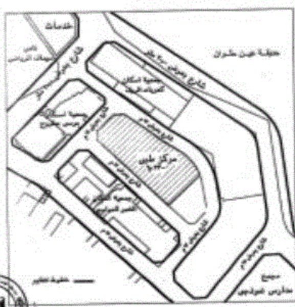
من مشروع التعمير بعض خطوط التنظيم بشروع الخدمات الصحية بمنطقة عين طوان بقرار محافظة القامرية رقم ١٥٥٩ لسنة ٢٠١٤