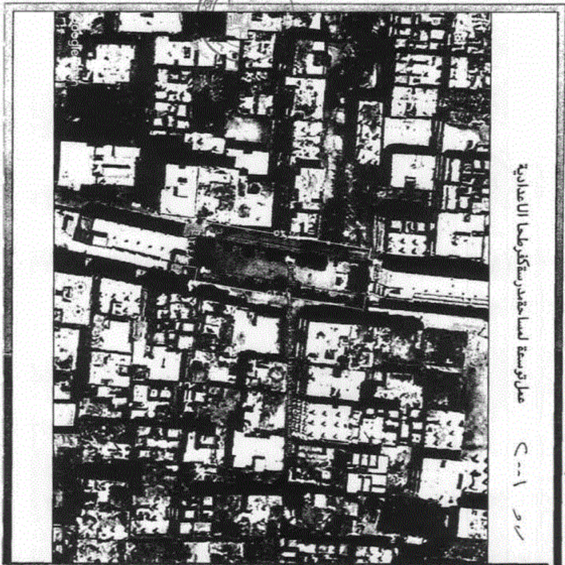
عمل توسعة المساحة بقرية طمايا الاعدادية C-1-1