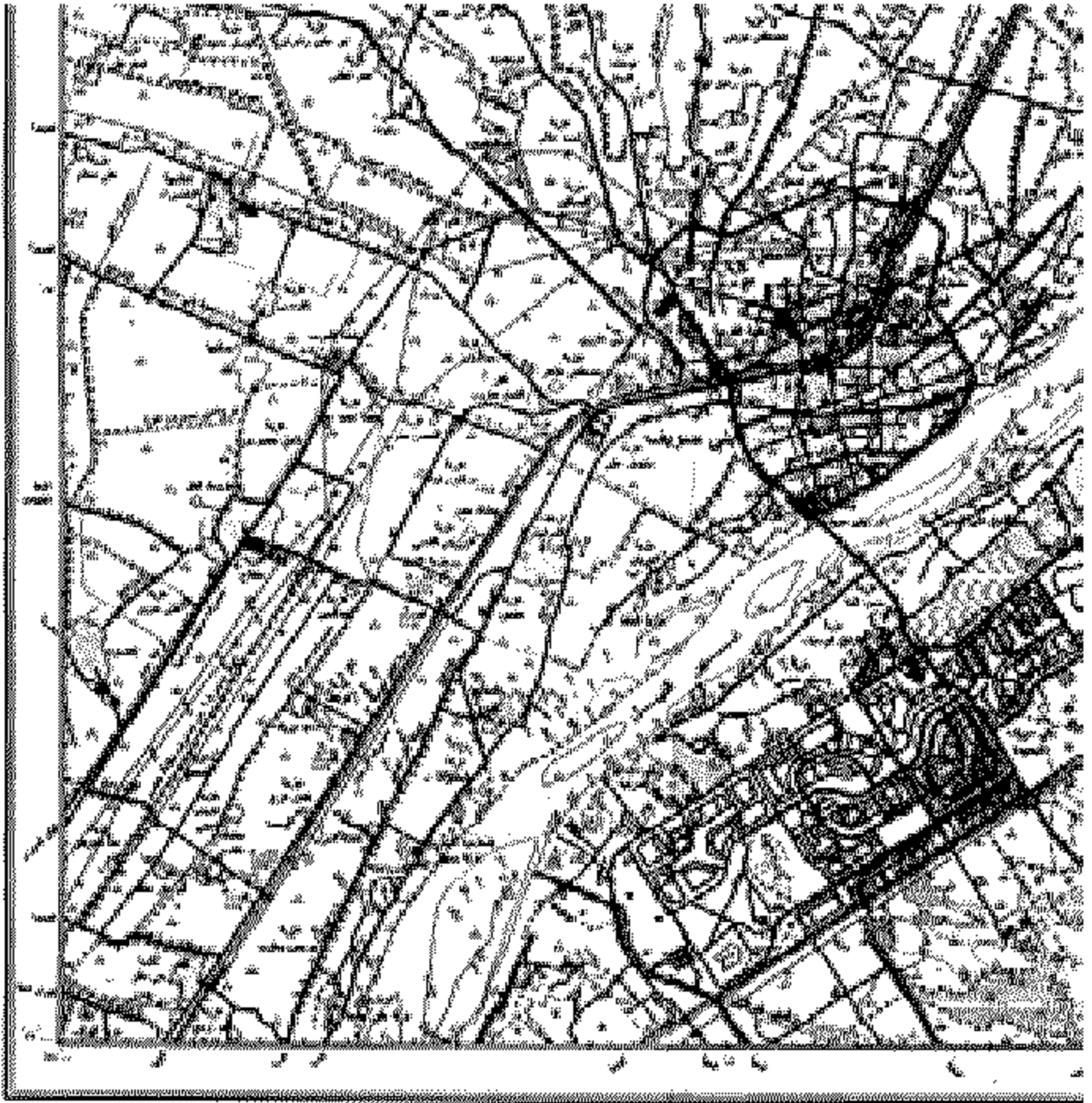
الخريطة رقم ١٦١ لسنة ٢٠١٦