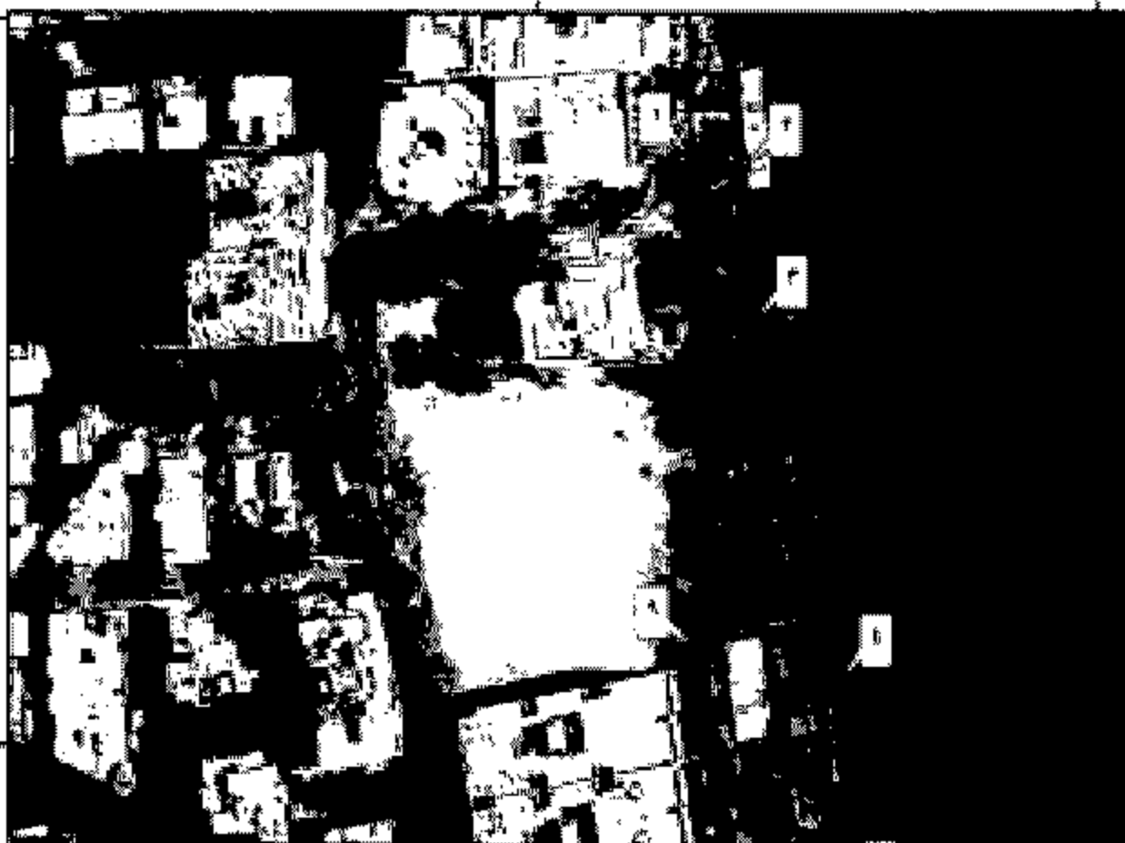
ملف الإحداثيات بنظام WGS 84