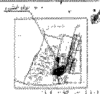
موقع الأرض في جمهورية مصر العربية