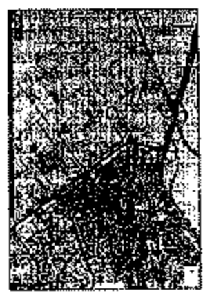
موقع المشروع بالنسبة للمدينة

نوع البناء: سكني و الترفيه والسياحة نوع الاستخدامات المقترحة للمدينة سوية 1 الكنتون