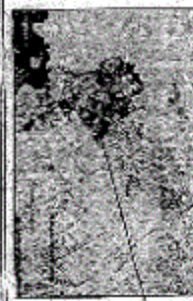
موقع المبنى على الأرض